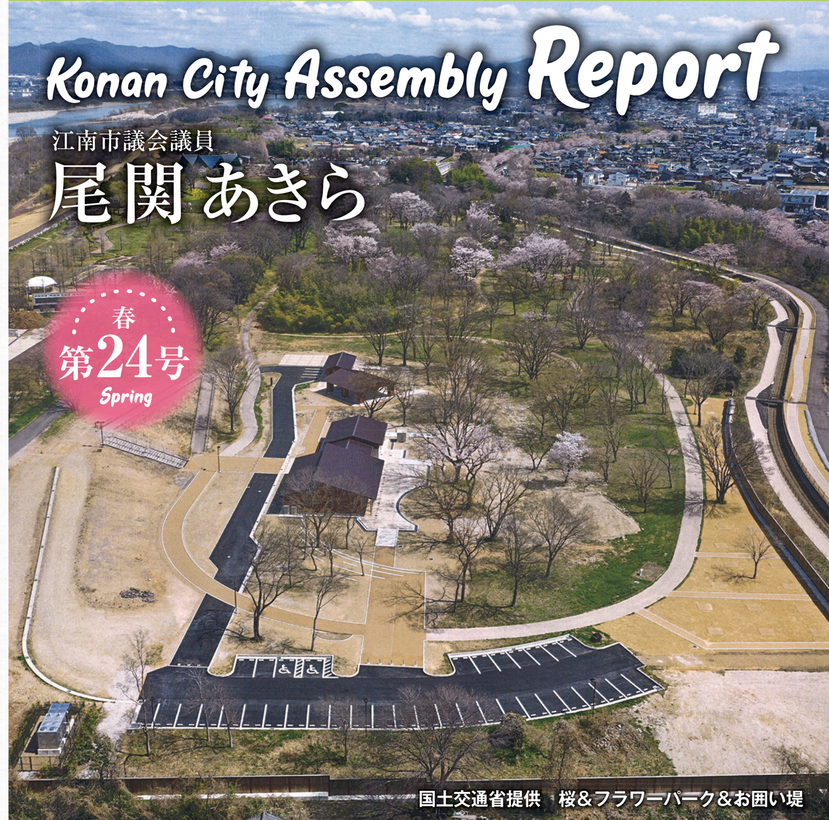
桜&フラワパーク&お囲い堤