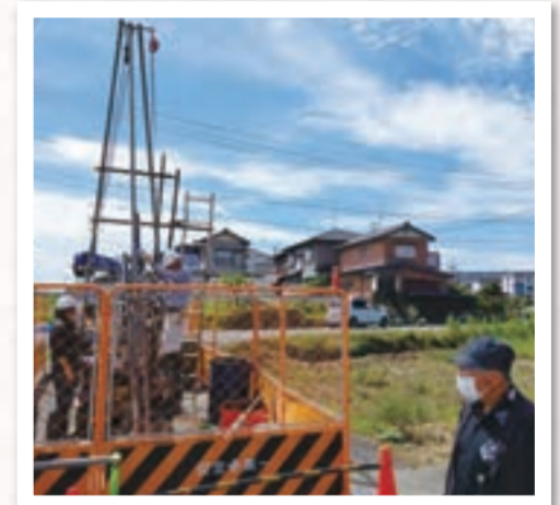
現地ボーリング調査の様様