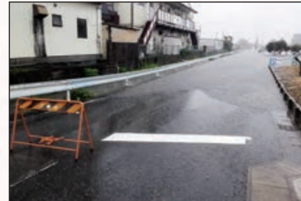
付近の浸水の様子