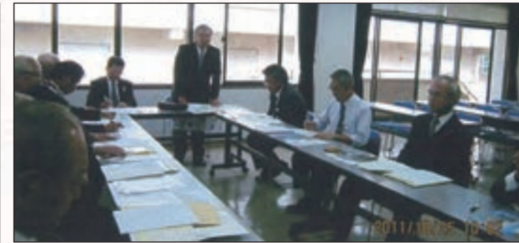
県へ要望書を提出(平成23年当時)