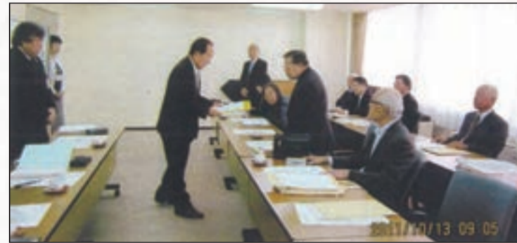
市へ要望書を提出(平成23年当時)