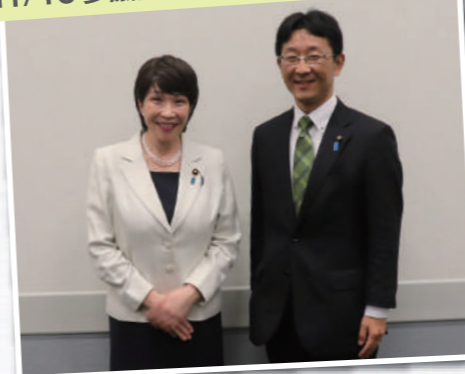
高市早苗 代議士との ツーショット ♪